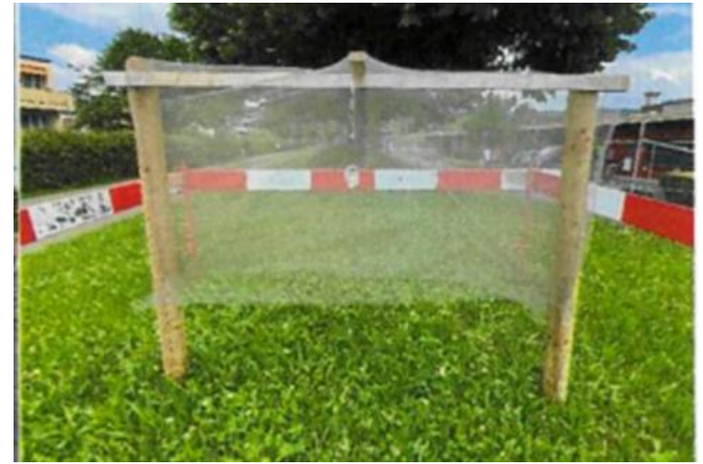
Käferfallen mit Netzen, welche mit Insektizid behandelt sind